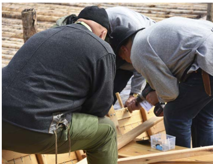
REPARASJON: Mellom finalene mellom Tømmerlundens og Glommen måtte det reparasjon til.