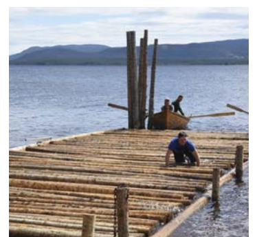
HEKTET AV: Glommens startmann slet i finalen.

Startmannen deres var litt uheldig og ble kjempende knallhardt for å komme seg opp igjen på tømmerstokkene